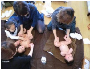
お姉ちゃんも一緒にマッサージに参加

産後の肥立ち、産後のママの精神やホルモンバランスの調整。育児への自信とゆとりができ、親子の絆づくりなどにも。